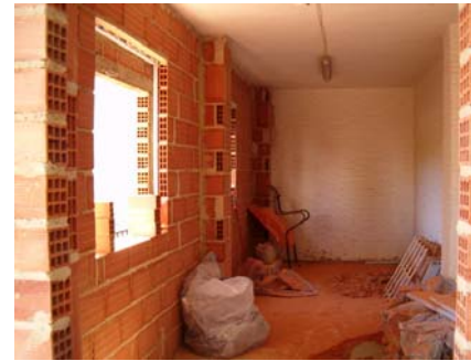
OBRA DE LOS NUEVOS SALONES